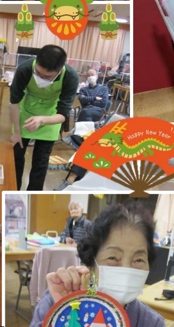
🍡 折り紙を使った Xmas プレート 🍡