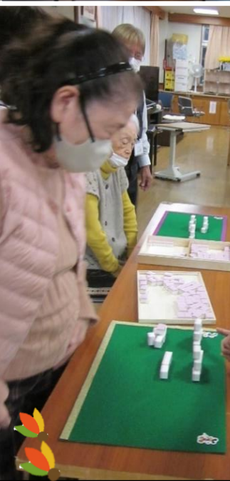
🍡 麻雀パイを使う麻雀ツムツムレクリエーション…積むだけと侮ることなかれ 🍡