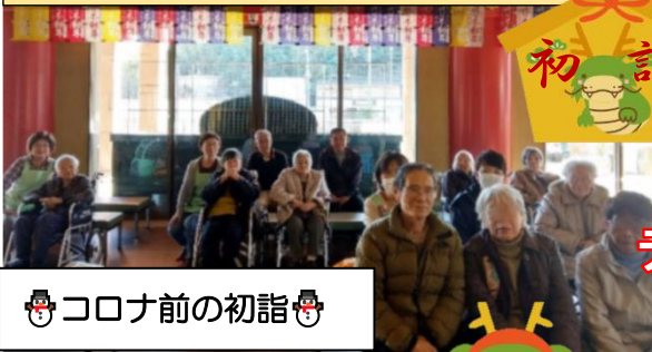
🍡 コロナ前の初詣 🍡