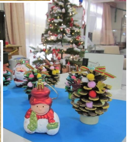
🍡 手作りレクリエーション 🍡 今年は、小田原産の松ぼっくり

りでご利用者と一緒にツリーを手作りしました。きれいに洗って乾かして、細かい所は職場体験に来てくれた中学生にも手伝ってもらって、本当にいい作品ができました！