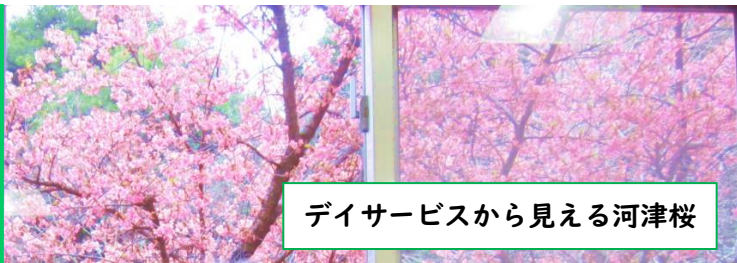
デイサービスから見える河津桜

🌸 わかば学園とデイサービスをオンラインで繋ぐ交流イベントで、特製ヘーゼルナッツチョコパンをいただきました。ご利用者が感想を伝え、様々なパンを作る苦労や工夫、普段の生活の事なども質問し合い、大変盛り上がりました。